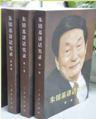
作者：朱镕基 出版：人民出版社

篇幅： 共四卷，收入了朱镕基担任国务院副总理、国务院总理期间的重要讲话、谈话、文章、信件、批语等 348 篇，照片 272 幅，批语、书信及题词影印件 30 件。