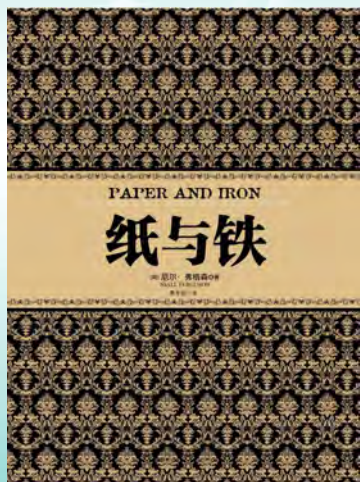
作者:[英] 尼尔·弗格森 出版社:中信出版社 定 价:69.00 元

许倬云先生以宏阔的视野与通俗的语言,高屋建瓴地描绘出一幅现代文明的全景图:从宗教革命到民族国家的兴起,从启蒙运动到工业革命到近代资本主义大发展,提纲挈领,要言不烦,勾勒出现代社会的形成及发展,反思了文明进步的得与失,展望了人类的前景。主宰人类生活三百年的主流文明,是如何兴起的?它经历了怎样的曲折和挑战?人类的未来会往何处发展?一部气势恢宏、雅俗共赏的大历史,一本剖析西方文明的大师之作。