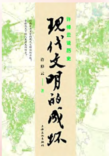
作者:许倬云 出版社:上海文化出版社 定 价:29.8 元